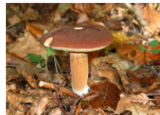
Hřib hnědý (panský)