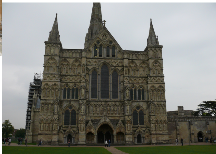
Katedrála v Salisbury