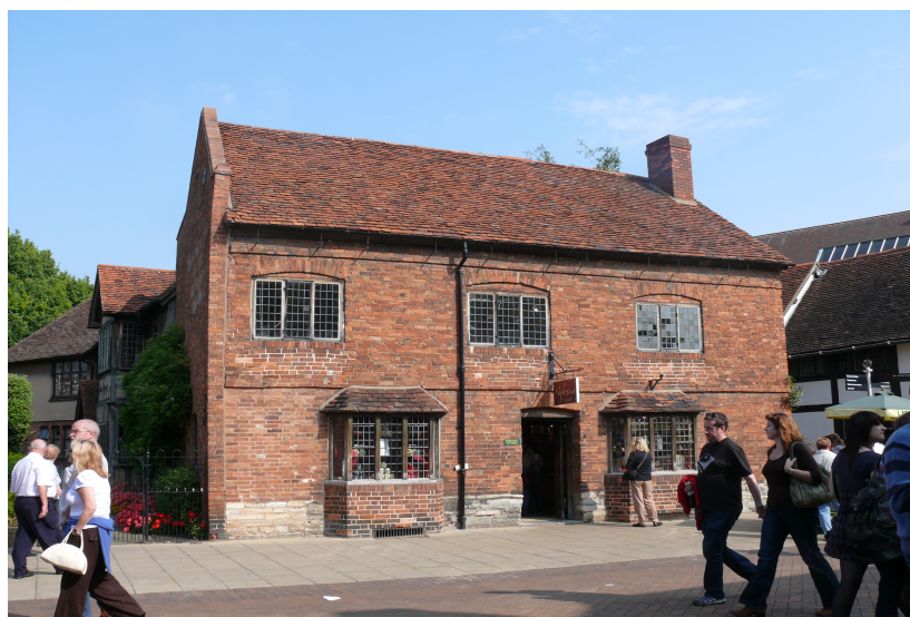
Stratford - dům W. Shakespeara