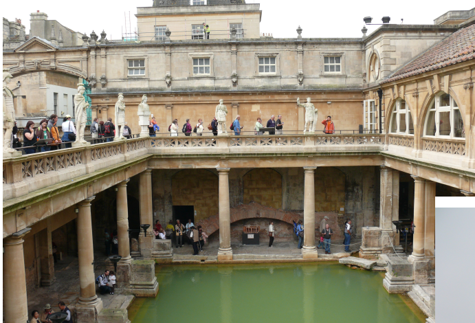
Lázeňské město Bath

Nejprve se vydáme autobusem na naší první zastávku do SALISBURY, kde si prohlédneme slavnou gotickou katedrálu a centrum zvané POULTRY CROSS. Po té se vydáme do údolí řeky Avony k městu BATH, kde se nacházejí staré římské lázně. Závěrem dne se vydáme k tradičnímu místu návštěvy a to STONEHANGE.