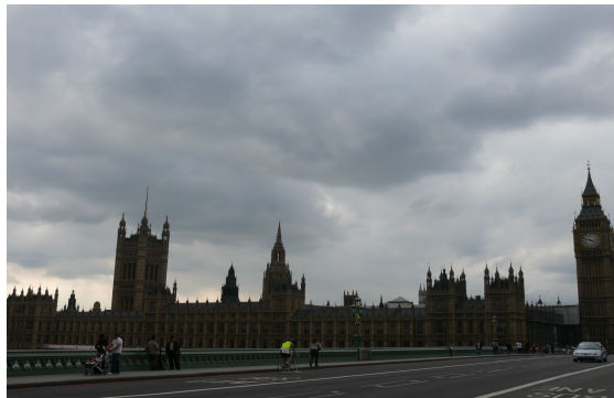
House of Parliament